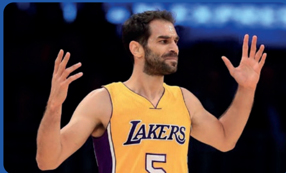
José Manuel Calderón

Calderón jugó y ascendió con el club Lucentum a la liga ACB en una temporada legendaria para el equipo. Jugó 14 temporadas en la NBA, convirtiéndose en el cuarto jugador español en jugar en esa liga.